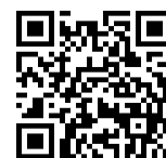
学生生活支援情報 HP