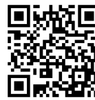
JASSO 奨学金シミュレーター

[3] 大学への入学時期（高校卒業から大学へ進学するまでの期間）が基準期間以内であること。